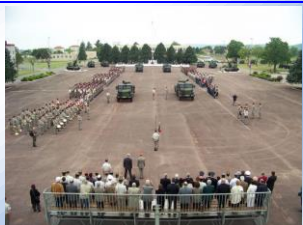
Camp de La Valbonne