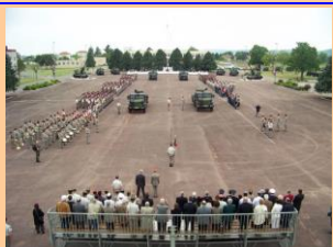
Camp de La Valbonne