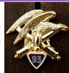
93° RAM– Varcès