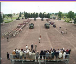
Camp de la Valbonne