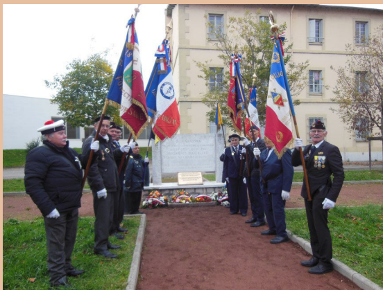
Les dix porte-drapeaux pendant la cérémonie